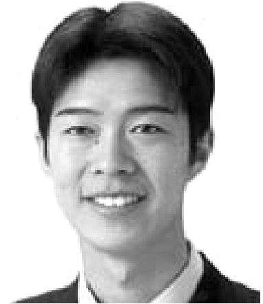
派遣されてしまった百衛隊の無事を祈ります